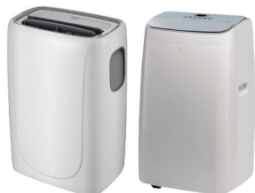
PTL F38 PTL F33 PTL BC38 PTL BC33