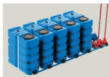
KIT STANDARD 5 x 2.400 l