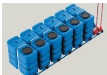
KIT STANDARD 6 x 2.000 l

Volumen total de 12.000 litros, fácil instalación. El precio incluye los kits de unión y 10 años de garantía de fabricante